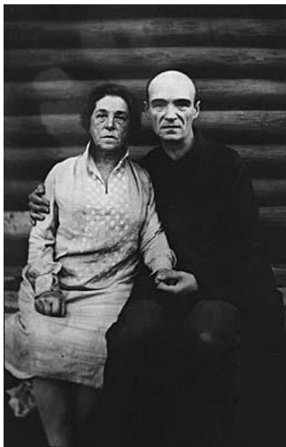
Фотография на Павел Н. Филонов и Екатерина Серябрякова (около 1928 г.) (От Глебова, Е. Н. Дневники Филонова в воспоминаниях его сестры Е. Н. Глебовой. – В: СССР. Внутренние противоречия. 1984. № 10, с. 164.; ОР ГРМ, кат. № 322)

каталози от участия в изложби са предадени в Държавния Руски музей в Санкт Петербург.