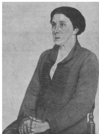
Фотография от портрета на Екатерина А. Серебрякова от 1922 г. (платно, маслени бои, 76 x 60 см. Неизвестно местонахождение) [От: Каталог к выставке „Очевидец незримого” в Государственном Русском музее и Государственном музее изобразительных искусств имени А. С. Пушкина. Изд. Государственный Русский Музей. Альманах. Вып. 147. СПб., Palace Editions, 2006. илюстр. № 86, с. 95.]

Не само това. Под четката на бележития руски майстор авангардист, първопроходецът на „аналитичното изкуство”, наред с много забележителни картини, натюрморти, портрети, се раждат и няколко изумителни портрета на членовете на семейство Серябрякови. Година след смъртта на Еспер Серебряков П. Филонов рисува скърбящата Екатерина. Те още не са оформили съжителството си.