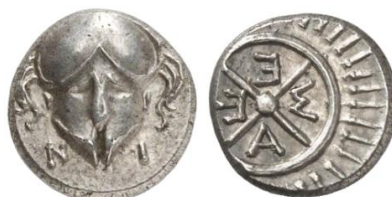
Обр. 4. Сребърен диобол (1,24 гр.) на Месамбрия, първата половина на IV век пр. Хр.

В заключение, историята и произходът на тази уникална месамбрийска монета е тясно свързана с Несебър, с бургаския край и с българското Черноморие. Тя за сетен път показва богатството и силата на антична Месамбрия през петото и четвъртото столетие преди Христа.