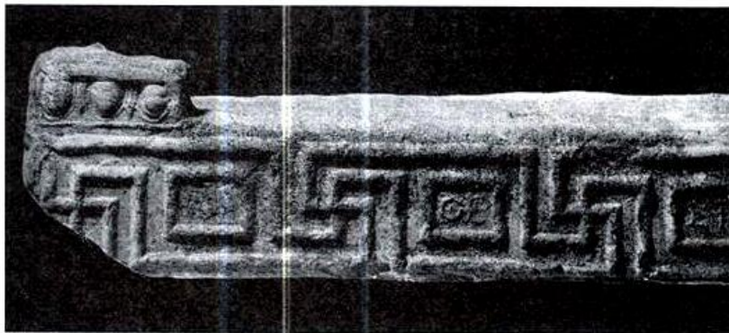
Обр. 3. Фасадна глинена керемида с украса (коринтски тип) с името на Антестерий от разкопки в Несебър, датирана в края на V – ранен IV век пр. Христа.